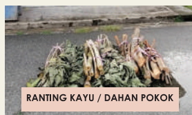
RANTING KAYU / DAHAN POKOK