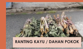
RANTING KAYU / DAHAN POKOK